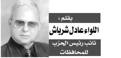
يقلم، اللواء عادل شراش نائب رئيس الحزب للمحافظات