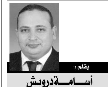
بقلم: أسامة درويش عضو الهيئة العليا